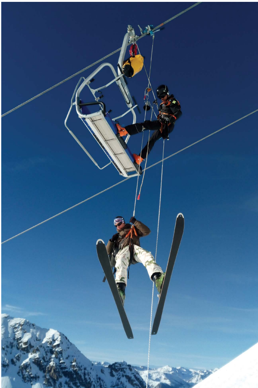
Evacuation du TS de la Crête, Montgenèvre