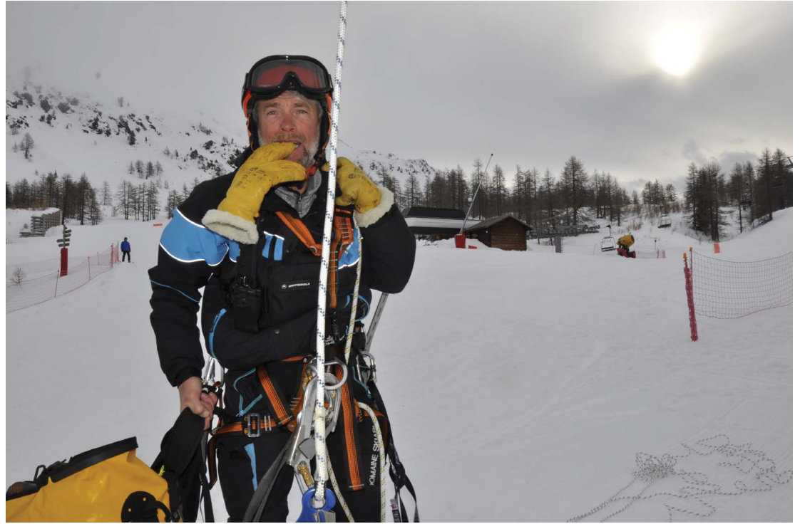
Jo en exercice évacuation TS, Montgenèvre