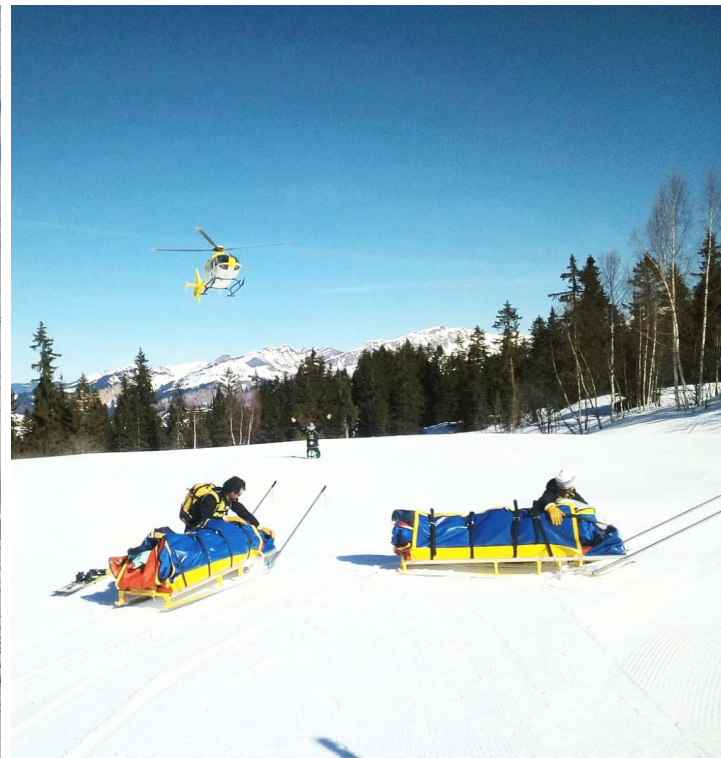
Évacuation des blessés suite à collision, Samoens