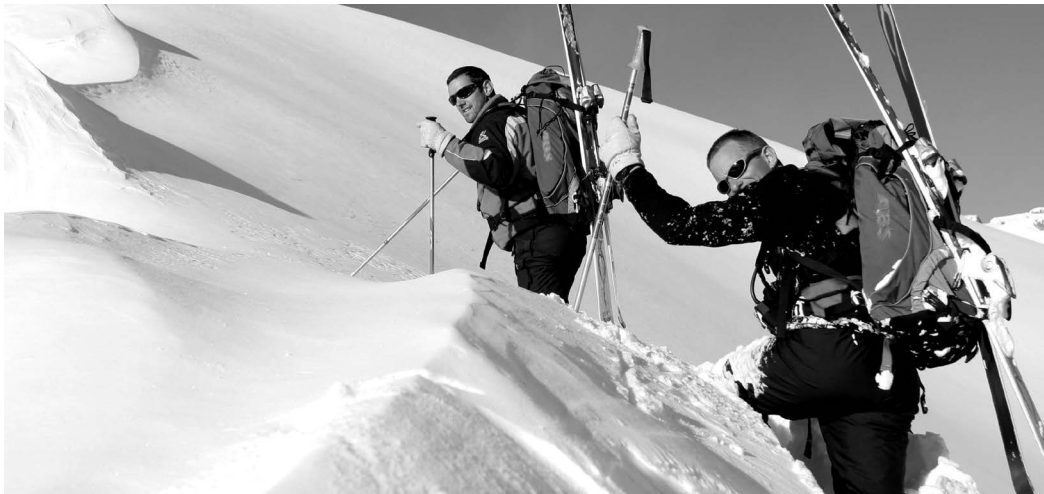
Départ PIDA