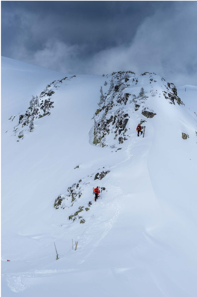
Départ en PIDA, Chamrousse