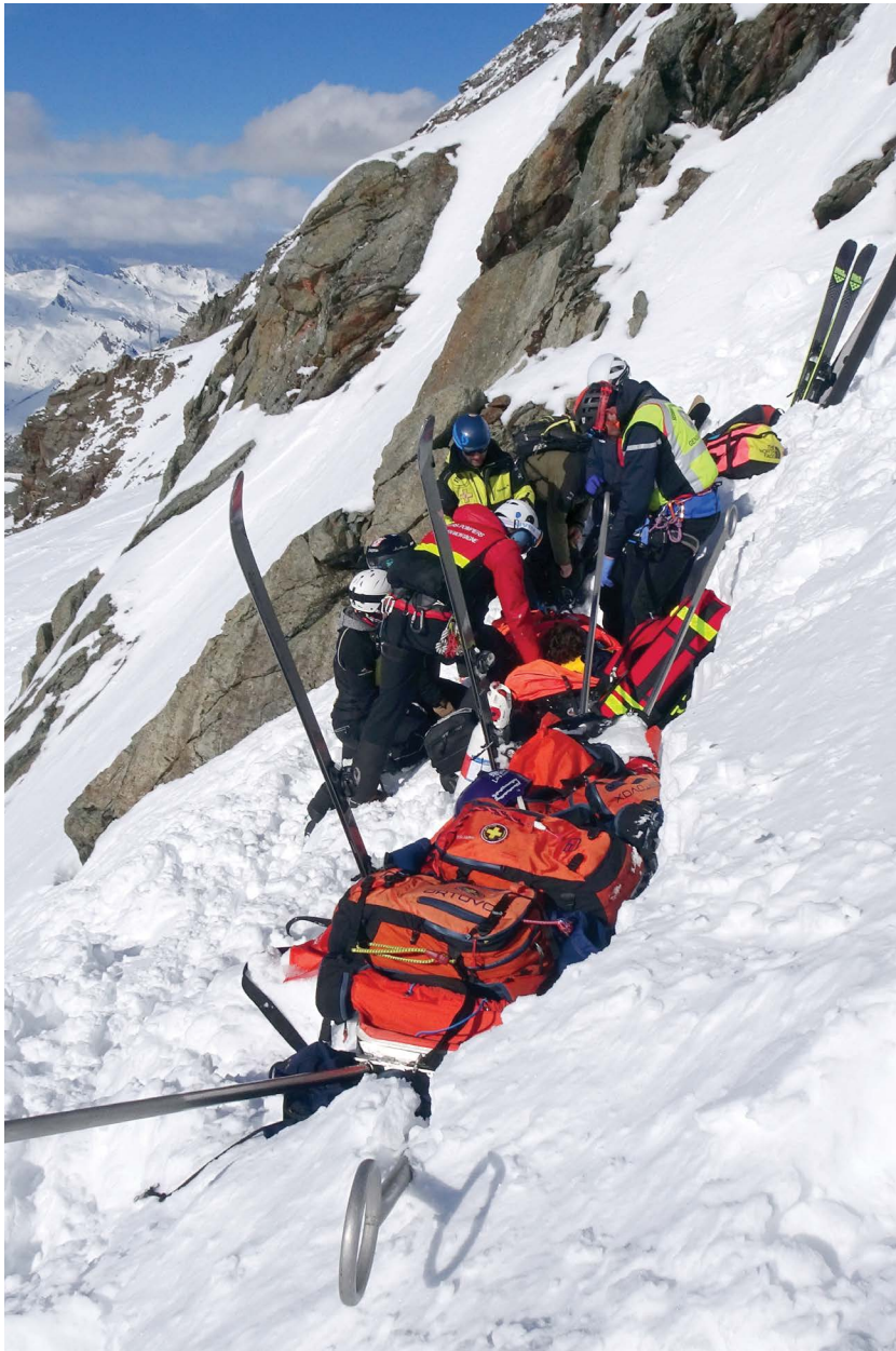
Secours hors piste, Les Arcs