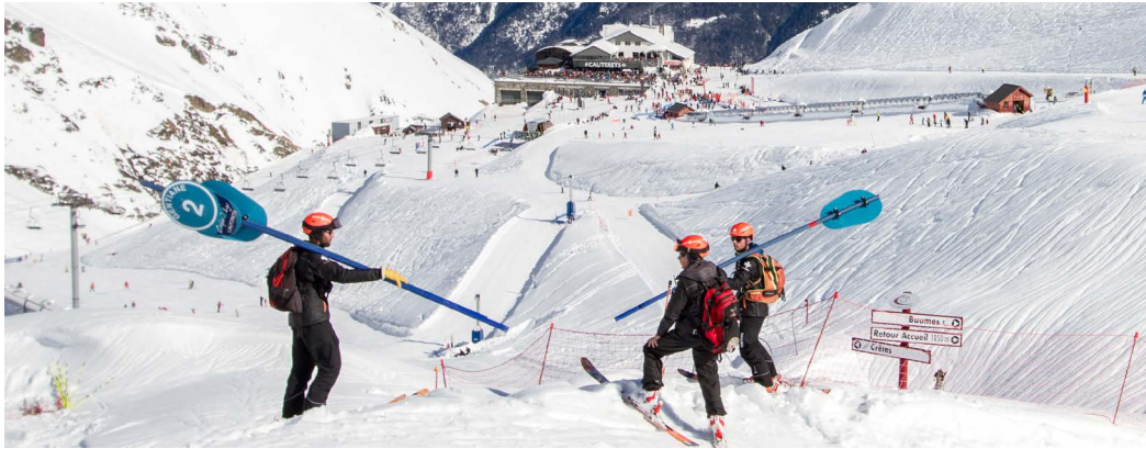
Mise en place du balisage à Cauterets