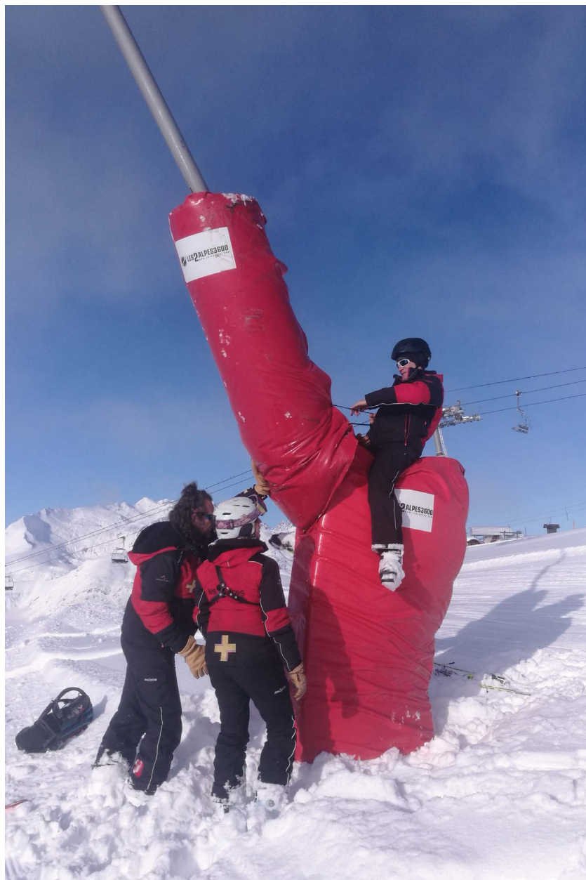
Pose de matelas sur enneigeur, les 2 Alpes