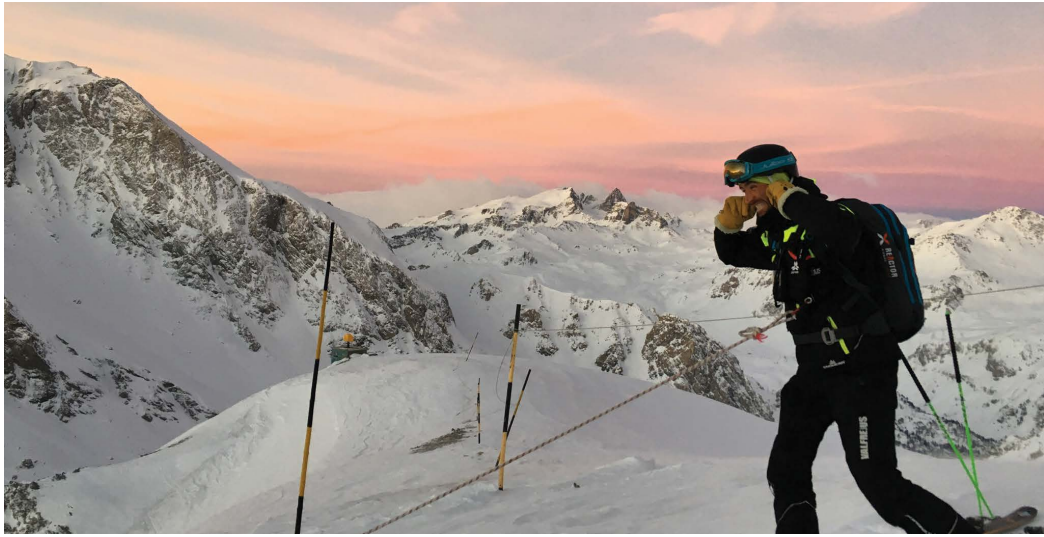
Déclenchement un jour de beau temps, Val Fréjus