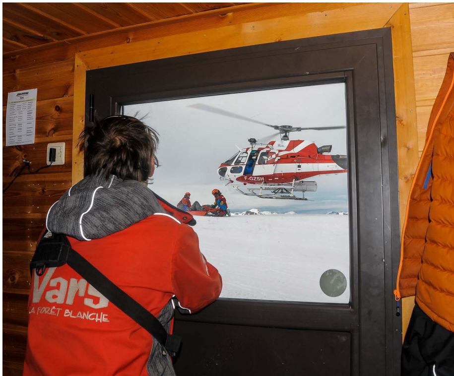
Secours heliporté secteur Peyrol avec Yo, Vars