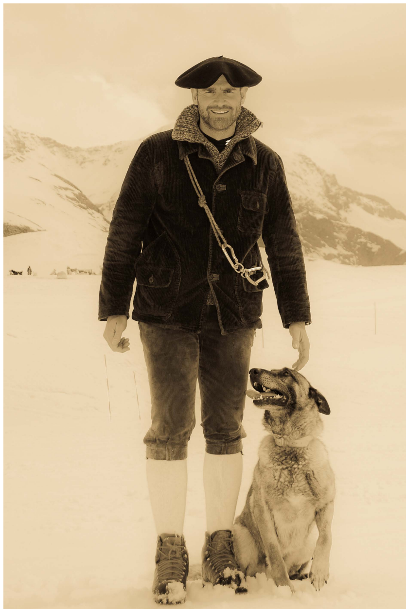
1 er challenge des maîtres chiens Alpes du Sud, en tenue d'époque