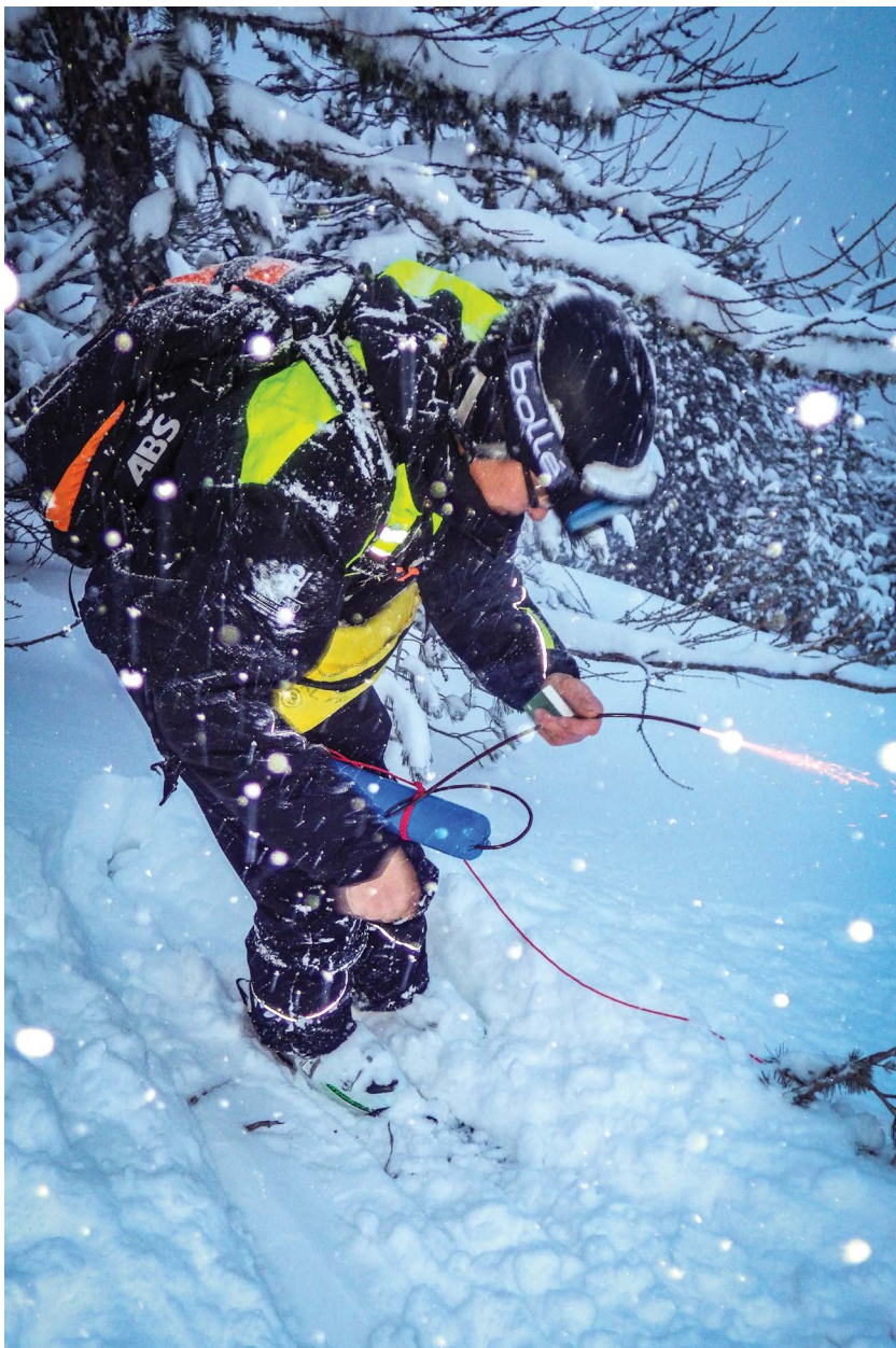
PIDA à la mèche lente, Val Fréjus

Ci dessus : à fond en barquette, Val Fréjus