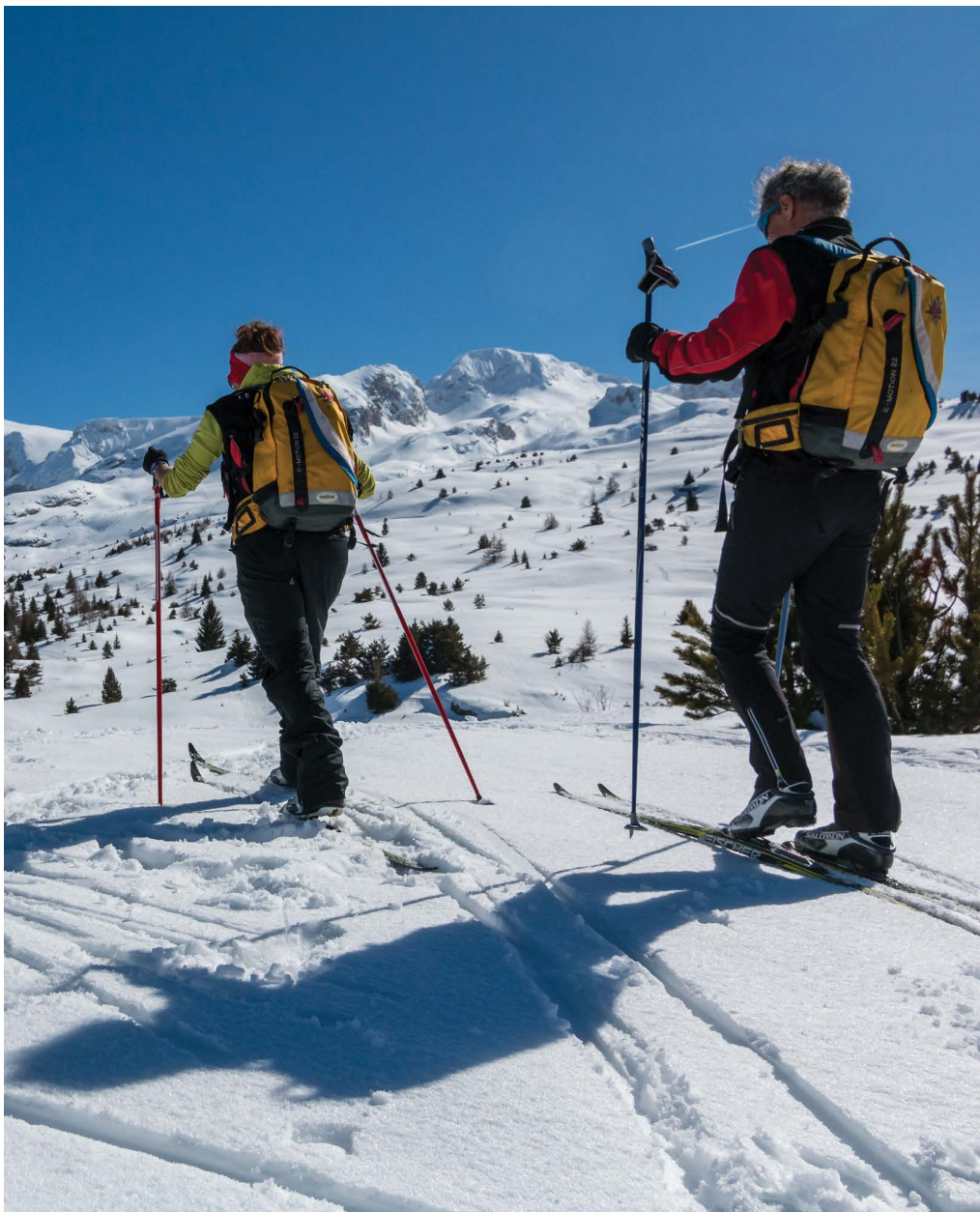
Patrouille dans le Dévoluy