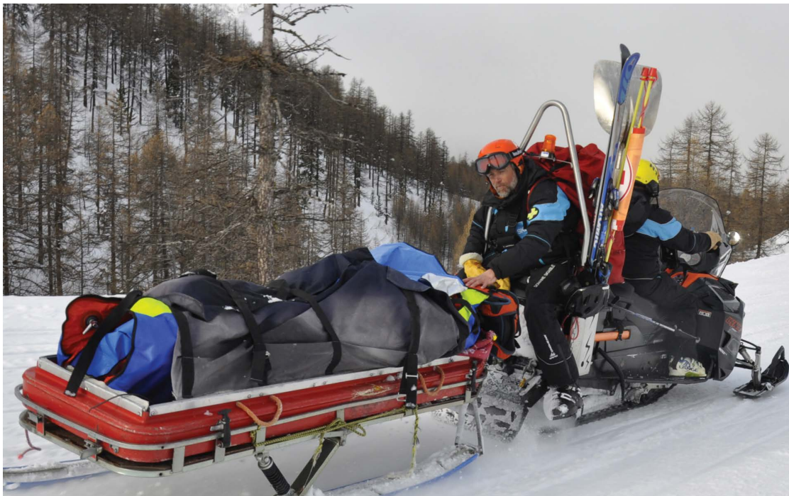
Surveillance pendant l'évacuation traineau scoot, Montgenèvre