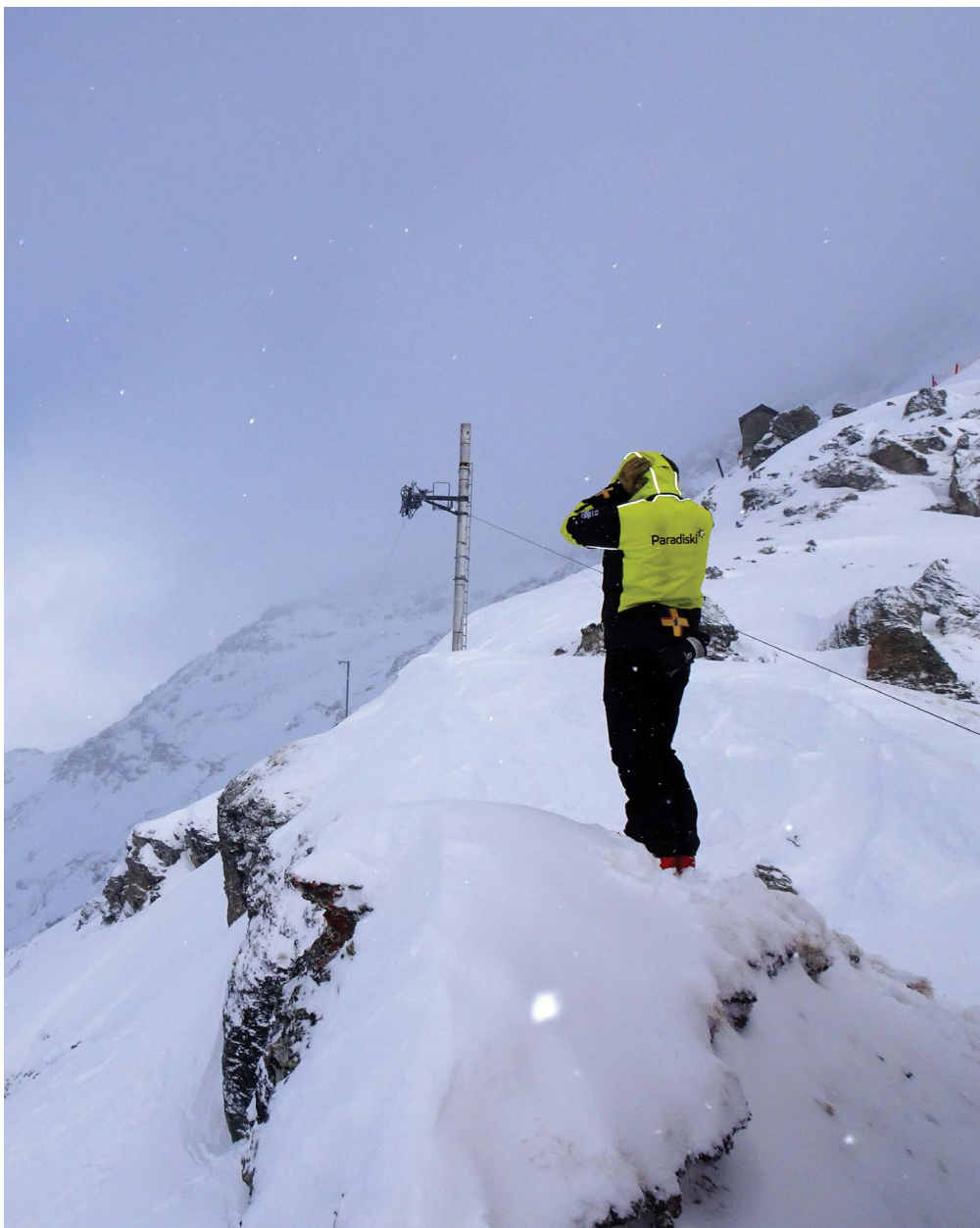
Catex, Boom dans 10s, Les Arcs