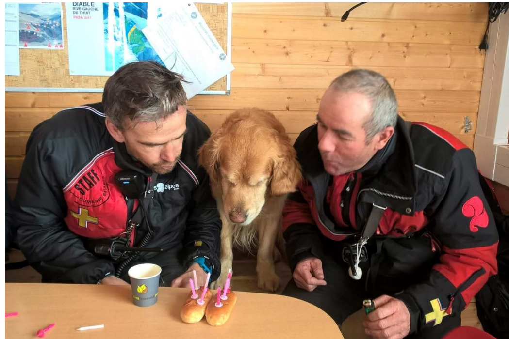
Joyeux anniversaire, Les 2 Alpes